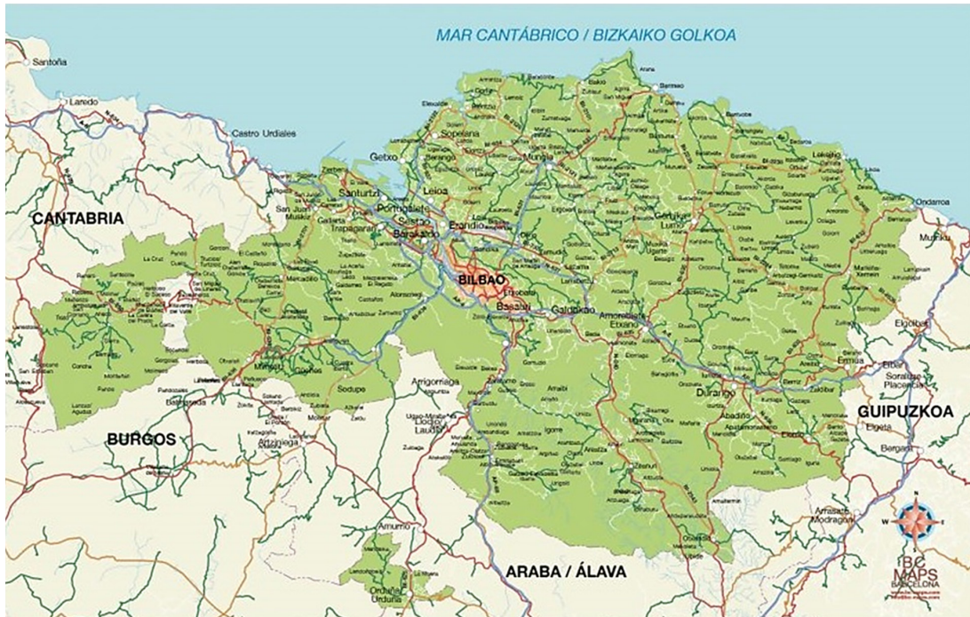
Mapa 1. Ubicación de Bilbao.