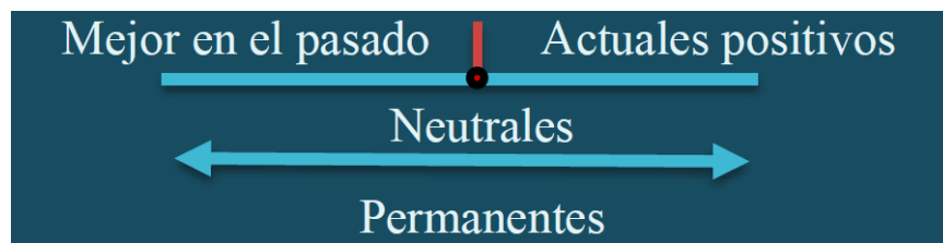
Figura 1. Grupos de percepciones.

El grupo Mejor en el pasado fue el segundo grupo más grande (n=36); lo constituyeron, principalmente, personas casadas, varones de edades entre 46 a 65 años, con estudios de bachillerato y universitarios con ingresos bajos. El grupo Actuales positivos (n=32) dejan ver la confianza que tienen hacia la implementación de normativas y uso de tecnología. Se constituyó, principalmente, por mujeres de edades entre 26 a 45 años; con estudios universitarios e ingresos entre los 1000 y 2000 euros. Los Permanentes fueron el grupo más grande (n=53), sus comentarios son alusivos a una continuidad en el consumo y sabor del jamón ibérico dado que es una tradición que no se pierde, que permanece en el tiempo. Se formó por la frecuencia mayoritaria de mujeres jóvenes (18 a 25 años); estudios de bachillerato y universitarios e ingresos bajos Finalmente el grupo Neutrales , fue el grupo más pequeño (n=9). No percibe diferencia en la calidad en el tiempo y tampoco tiene interés en dar una explicación más amplia sobre su aseveración. Lo conformaron, principalmente, solteros con ingresos entre 500 y 1,000 euros (ver Tabla 2).