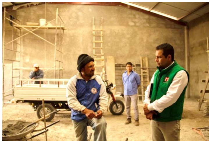
Imagen 9. Etapa inicial de la Procesadora y Centro de Acopio, Acelotla Zempoala.

En las constantes visitas al municipio, se reconoció el trabajo de los Productores de Nopal-Verdura de Acelotla (Mapa 1); el Núcleo Ejidal (NE) se encuentra en su mayoría parcelado, seguido por uso común y en pequeña proporción para asentamientos humanos (Cuadro 6). Cerca de dos años se impulsa la producción nopalera (variedad Copena 1) a partir del beneficio que recibieron del Programa Alto Impacto Productivo en Zonas Áridas y Semiáridas de México de la Comisión Nacional de Zonas Áridas (Conaza). La primera etapa del proyecto consistió en la construcción de cinco macro-túneles y la línea de conducción de agua (tanque); segunda fase, construcción del Centro de Acopio y Procesadora (CAyP), 20 % recursos propios, la restante inversión por parte de la política pública agraria (Imagen 9); tercera etapa se enfoca en transformar el nopal-verdura en harina comestible.