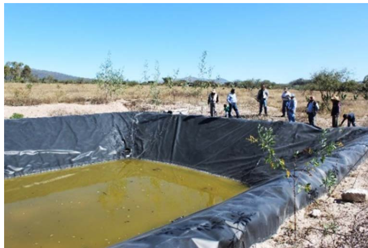
Imagen 7. Olla de captación de agua con los productores de nopal-verdura de San Francisco Tecajique, San Agustín Tlaxiaca.

El otro grupo localizado durante recorrido, productores de nopal-verdura del Ejido de San Francisco Tecajique, máxime espacio parcelado, seguido por uso común (Cuadro 6) (Mapa 1). Acorde a la información recabada en campo, menos de siete años cosechando nopal-verdura (atlixco y milpa alta), adultos de hasta 45 años. Cada uno de ellos cuantifica entre cuatro y seis hectáreas, frontera sin continuidad espacial en su haber, hasta el 20 % es utilizable. Existe presencia relativa de agricultura protegida y biopreparados artesanales, sin norma que valide. Araña roja, caracol y gusano barrenador, son las plagas más frecuentes. El peso mayoritario de asistencia técnica proviene del conocimiento adquirido en el tiempo, la parte restante de la política pública agraria (extensionistas). La producción se distribuye entre mercados locales (San Agustín Tlaxiaca y Pachuca) y autoconsumo. La falta de agua (a pesar de contar en promedio con tres ollas de captación sin operar) y capacidades tecnológicas para la transformación, principales limitaciones productivas afirman los productores (Imagen 7). Se cosechan, con tendencia a la baja, entre 15 a 30 cajas por hectárea, llega a venderse entre 40 y 80 pesos. 19