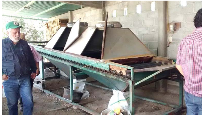
Imagen 3. Desespinadora nopal-fruta, Chicvasco, Actopan.