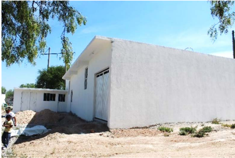
Imagen 11. Centro de Acopio de nopal-verdura, Lagunilla.

Fuente: imagen capturada por el autor, el 16 de junio 2017 Lagunilla, Zempoala