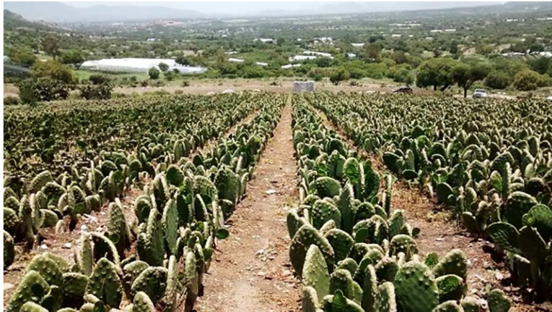
Imagen 1. Producción de Nopal en El Rincón, El Arenal.

Fuente: imagen capturada por el autor, el 30 de junio 2016. El Rincón, El Arenal.