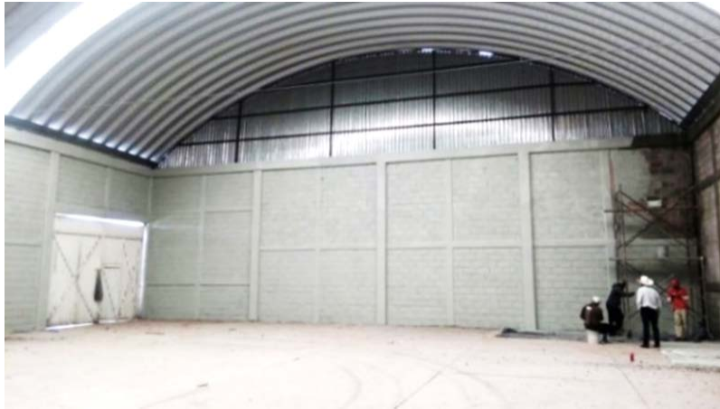
Imagen 10. Interior del Centro de Acopio Tunazem.