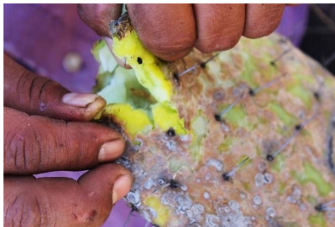
Imagen 5. Enfermedad nopal-fruta en San Juan Solís, San Agustín Tlaxiaca.

generalidad de las huertas sobrepasa los diez años, son de talla grande, se acercan al límite de altura y cobertura, requiere poda de rejuvenecimiento ( \approx 2 m de altura y 3 m de diámetro) antes de que se empiece a dificultar la cosecha y el tránsito entre las hileras de la huerta. Este tipo de poda es el más costoso por el volumen de material vegetativo que hay que remover, el retraso y la reducción de la producción atribuible a la recuperación de la estructura productiva de la planta (Mondragón y Ávila, 2013).