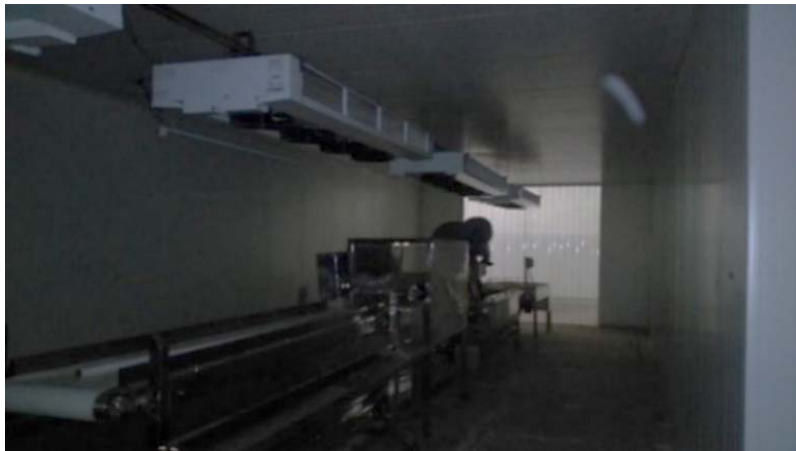
Imagen 2. Infraestructura industrial de grado alimenticio de la PCAER.

obedece al apoyo recibido de los productores por parte del gobierno federal (Secretaría de Agricultura, Ganadería, Desarrollo Rural, Pesca y Alimentación), componentes excedentes del petróleo. La procesadora contabiliza seiscientos metros cuadrados, aparte de oficinas, estacionamiento, patio de carga y área verde. En sus inicios fue controlada por la figura jurídica Triple S (Sociedad de Solidaridad Social), tiempo después atendida por 23 personas, perteneciente a diferentes comunidades alrededor de El Arenal, se transforma a Sociedad de Producción Rural de Responsabilidad Limitada (SPRL). 13 La frontera agrícola nopalera de los socios equivale en promedio a cincuenta hectáreas. A pesar de que la PCAER tiene vigencia de derechos fiscales ante el Servicio de Administración Tributaria (SAT), luz eléctrica, accesos privilegiados de carretera, infraestructura industrial de grado alimenticio (lavadora industrial, máquina de pre-secado, tina de saneamiento, banda de selección, mesa de desespina, máquina peladora, máquina de empaque-atmosfera modificada), peladora que no se ajusta al tamaño promedio del nopal, cuarto de enfriamiento, bascula de pesar, son limitados los alcances productivos, aún se sigue enfocando los esfuerzos en perfeccionar la línea del producto (Imagen 2).