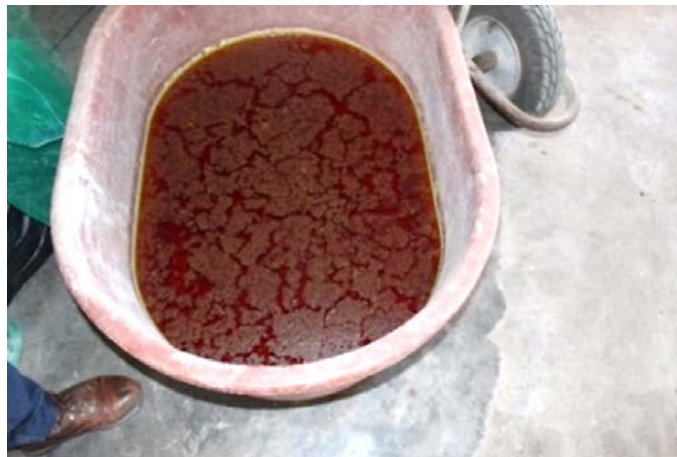
Imagen 6. Exiliado de lombriz de Tornacuxtla, San Agustín Tlaxiaca.