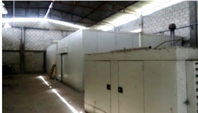
Imagen 4. Cámara de refrigeración del CAT-BB.

viabilidad tecnológica del centro por parte de los socios de la Integradora mucho menos por parte de la política pública agrícola de la entidad hidalguense.