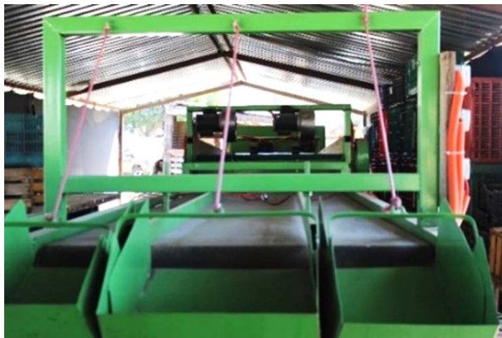
Imagen 8. Desespadora, Tepayahualco, Zempoala.

utiliza la producción del nopal-fruta; 2.70 toneladas se obtienen en promedio sobre hectárea. Destaca que, a diferencia de los municipios antes descritos, 10 % del espacio agrícola existe el derecho de la tierra por rentar, aparecería o prestar (Cuadro 4 y 5). Aún la actividad agrícola es la principal fuente de ingresos en los hogares de Zempoala (71 %), seguido de pecuario (19 %) y de apoyos gubernamentales (11 %) (Sagarpa y FAO, 2014). La localidad de Tepayahualco quizás permiten explicar la funcionalidad de la producción tunera; el espacio agrícola en demasía se encuentra parcelado, seguido por parte mínima de uso común (Cuadro 6) (Mapa 2). Por la información primaria recabada, cerca de diez ejidatarios conforman la Sociedad Cooperativa de Tuna Tepayahualco, veinte años trabajando como productores, hace tres empezaron a retomar la producción de tuna-alfajayucan y la tuna-roja; promedio de edad cercano a los sesenta años. La producción de tuna, la segunda fuente de ingresos por parte de los productores. Se caracterizan por experimentar el atraso de la producción de tuna máxime por el precio que puede alcanzar. En tiempo de temporada contratan entre diez y quince jornaleros, se cuenta con desespadoras de grado industrial ubicadas al interior de algunos hogares; inversión de la política pública agraria y productores (Imagen 8).