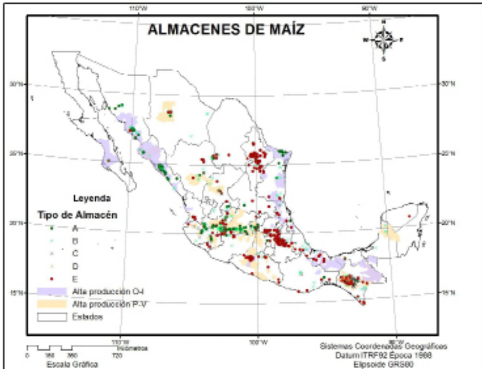
Figura 3. Ubicación geográfica de los almacenes conforme a la tipología